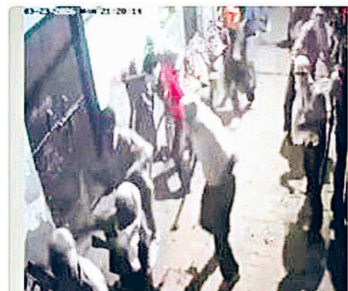
हरिभूमि न्यूज ▶▶ फरीदाबाद

ओल्ड फरीदाबाद थाना क्षेत्र की बसेलवा कॉलोनी में सोमवार देर रात दो पक्षों के बीच जमकर पत्थरबाजी होने से कॉलोनी वासियों में खौफ पैदा हो गया। करीब 10 से 15 मिनट तक दोनों गुटों के नकाबपोश नवयुवक एक-दूसरे पर ईंट-पत्थर बरसाते रहे।