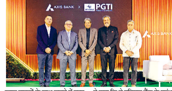
हरिभूमि न्यूज ▶▶ गुड़ग्राम