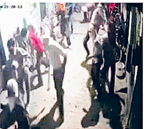
हरिभूमि न्यूज ▶▶ फरीदाबाद

ओल्ड फरीदाबाद थाना क्षेत्र की बसेलवा कॉलोनी में सोमवार देर रात दो पक्षों के बीच जमकर पत्थरबाजी होने से कॉलोनी वासियों में खौफ पैदा हो गया। करीब 10 से 15 मिनट तक दोनों गुटों के नकाबपोश नवयुवक एक-दूसरे पर ईंट-पत्थर बरसाते रहे।