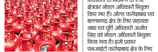
हरिभूमि न्यूज ▶▶ फरीदाबाद

एलपीजी की कालाबाजारी रोकने के लिए नोडल अधिकारी नियुक्त