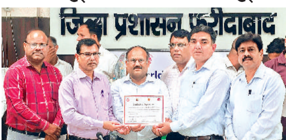
हरिभूमि न्यूज ▶▶ फरीदाबाद

टीबी मरीजों को प्रोटीन किट व पोषण सहायता देने की अपील